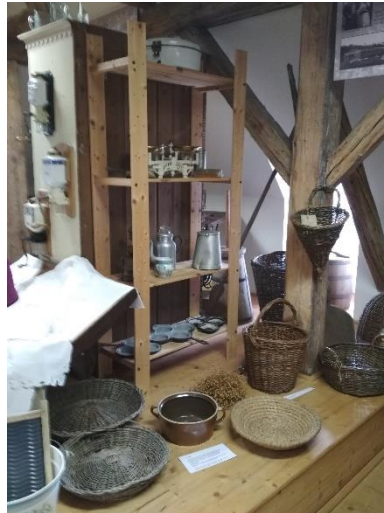
Uložit bylo třeba spoustu exponátů