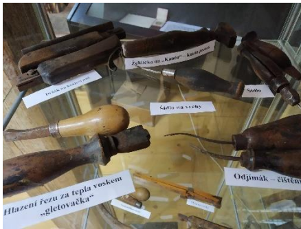
Popisky drobného nářadí

Starosti přidělovalo i vyprázdnění prosklených vitrín, ve kterých bylo uloženo ševcovské nářadí. Jeho popisky nám kdysi pracně vytvořil starý švec, a už bychom si bez něho asi těžko troufli znovu popisky rozmístit. Proto jsme všechny tyto vitríny nafotili a pokusíme se je podle fotek znovu instalovat. Kdy ale dojde k znovuotevření muzea nebo zda vůbec, v této chvíli opravdu netušíme. Nedostaly se k nám žádné neinformace.