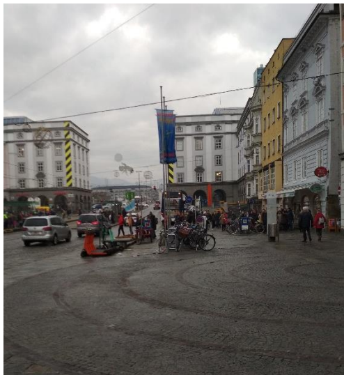
Náměstí s množstvím kol a infocentrem

Cestou domů jsme po celodenním chození odpočívali nebo sledovali výzdobu domů kolem silnice. Byla už tma, tak bylo vše krásně vidět. Nikdo se neztratil, nikomu se nic nestalo, a tak jsme se šťastně vrátili s konstatováním, že to byl hezký prožitý den.