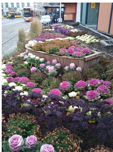
Adventní trhy a vedle tato krása