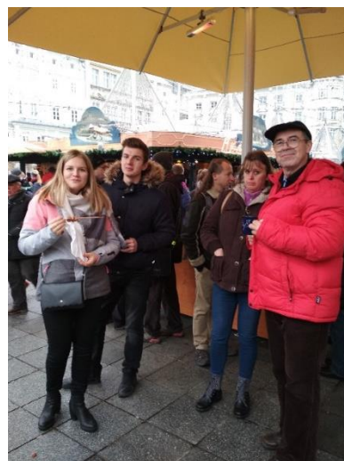
Pohoda s dobrotami a punčem. Na zdraví!

Klidný čas adventní, krásné Vánoce a hodně zdraví a štěstí v novém roce 2020.