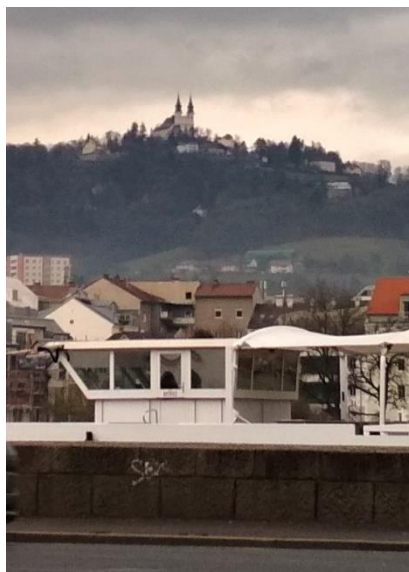
Vrch Pöstlingberg se tyčí nad městem