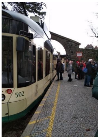
Návrat z Pöstlingbergu