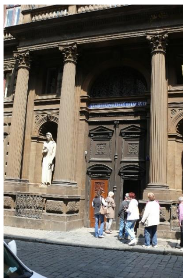
Bývalý Schebkovský palác v Praze